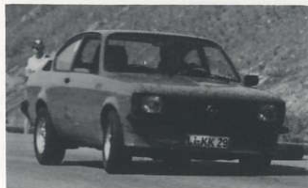
Günther Kirschbaum auf Opel-Kadett beim Automobil-Slalom Lindau