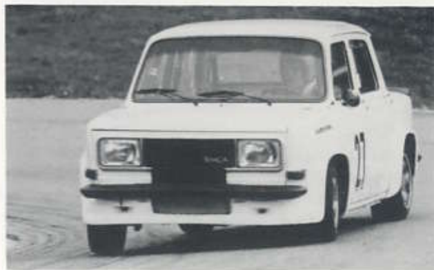
Norbert Gapp driftet seinen Simca Rallye 3 durch eine Kurve beim Auerbergrennen.