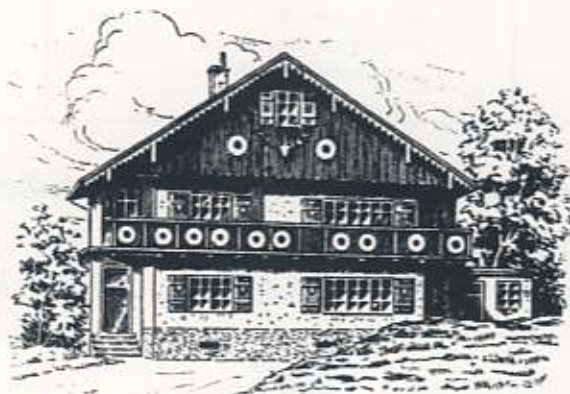
Schützenhaus am Schönbühl

8990 Lindau (B) · Kemptener Straße, am Schönbühl · Tel. 6560