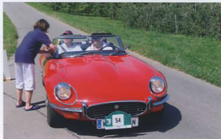
Unsere Freunde aus Wien auf Jaguar E Type Bj. 1972