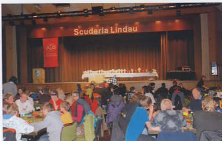
Volles Haus in der Inselhalle