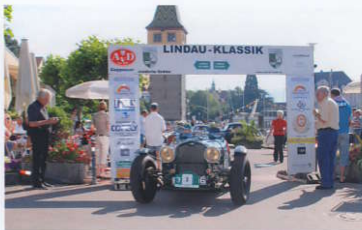
Start an der Seepromenade Triumph Special G Bj. 1936

Die Vormittagsrunde führte über Eichenberg ins wunder-