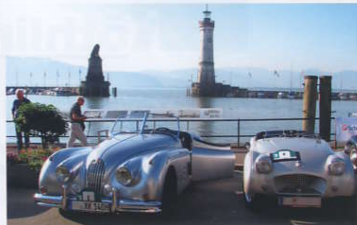
Morgenstimmung am Hafen