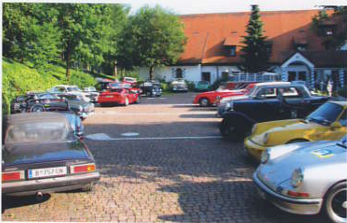
Siegerehrung Golfhotel Bodensee Weißenberg