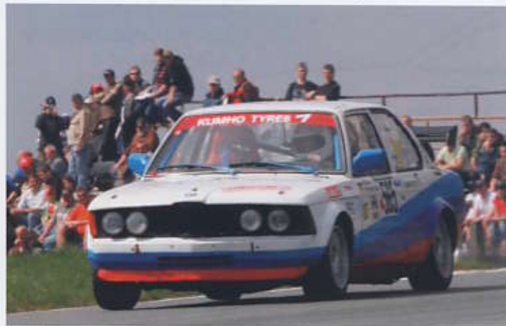
Ilka Stecher-Zeller unterwegs im BMW 320 E21 Bj. 1976