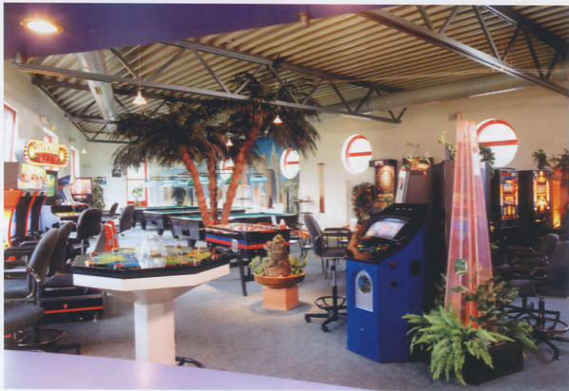
Billard-Café „Monte Carlo“, Lindau, Robert-Bosch-Str. 40, 1. Etage Aral-Tankstelle am Autobahnzubringer

Wer nicht länger auf sein Glück warten will, sollte ihm etwas entgegenkommen.