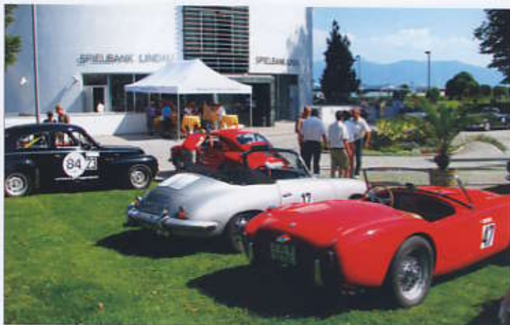
Ziel und Erfrischungsdrink an der Bayerischen Spielbank Lindau