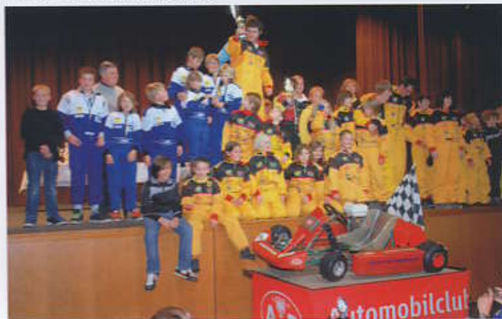
Die erfolgreichsten Mannschaften