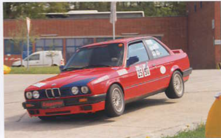
Norbert Gapp im vollen Einsatz