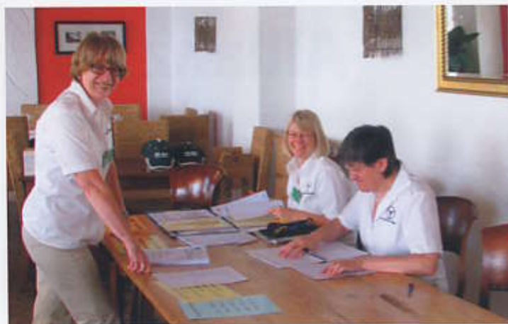
Unsere Damen bei der Papierabnahme der Lindau-Klassik