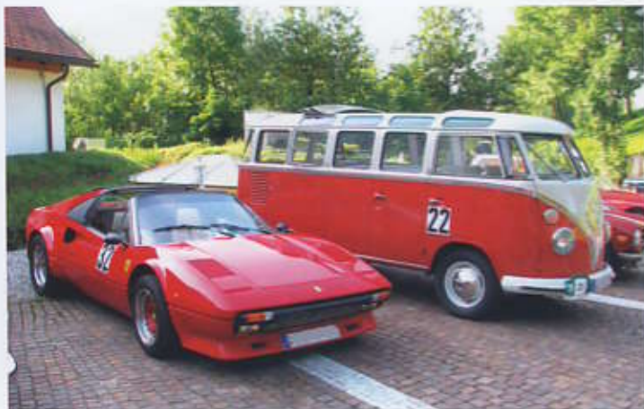
Ferrari u. VW Samba, dass gibt es nur bei der Lindau-Klassik