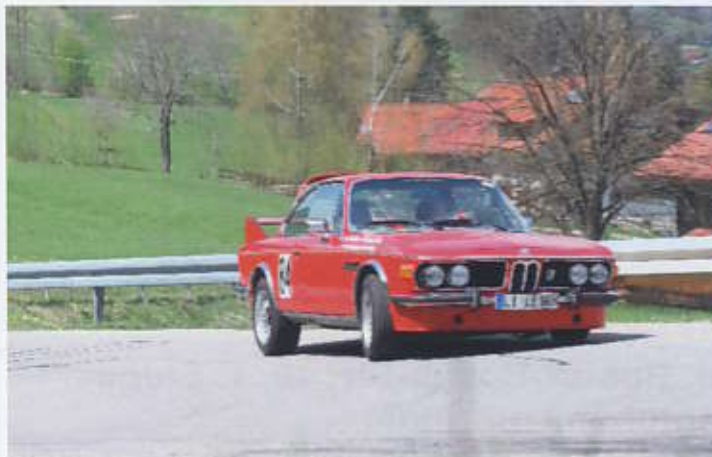
Ernst Laufer auf BMW 3,0 CSi Bj. 1975