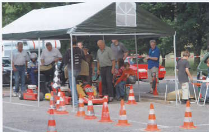
Am Start zum Kartslalom