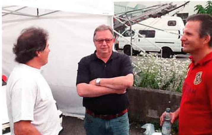
3 Fahrer aus dem Vorstand