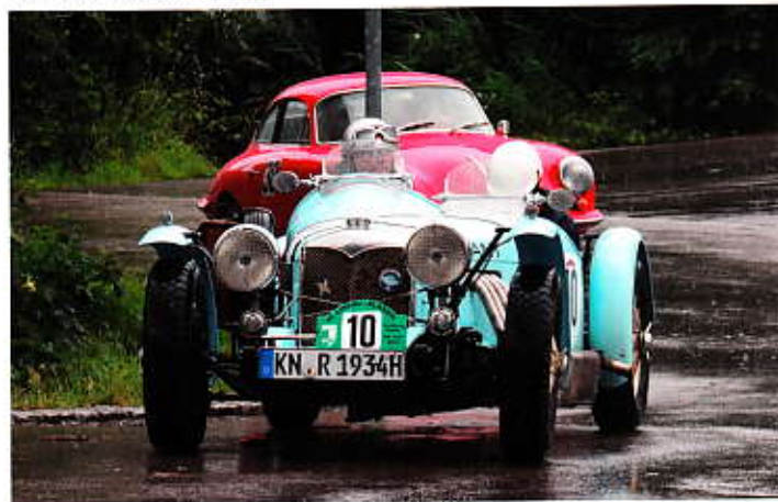
Kein Vergnügen im offenen Riley spezial Bj. 1934