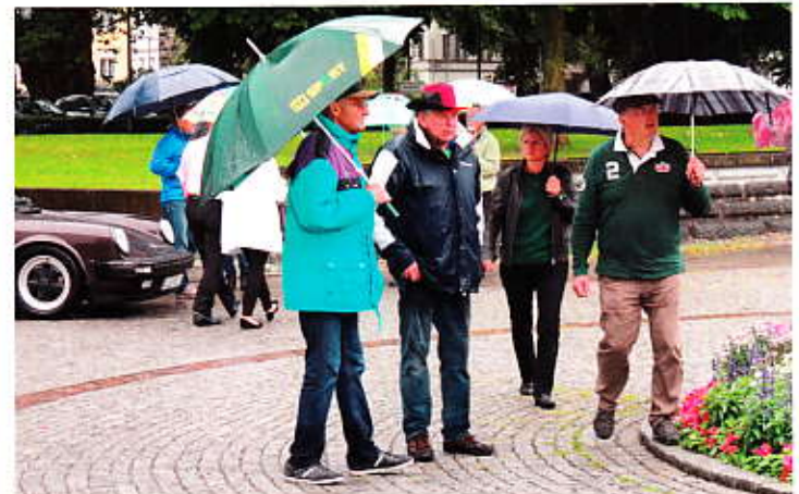
Parkplatzordner im Regen