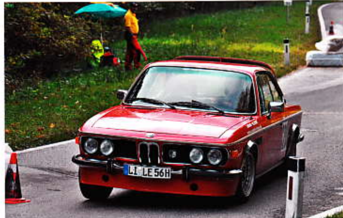
Flotte „Oldies“ Mercedes 220 SE und BMW 3,0 CSI