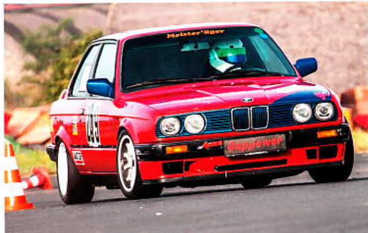
Marcel Gapp auf dem BMW 318i