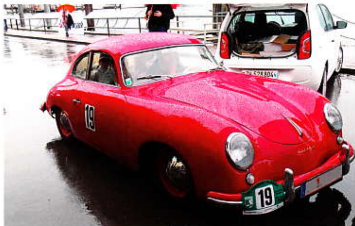
Seltenes Stück Porsche 356 vor A „Knickscheibe“