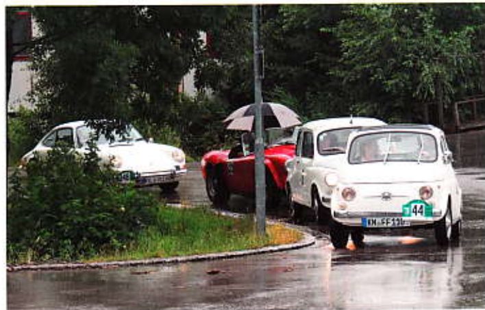
Klein, aber mit Dach Fiat 500 und Zastava 770 Bj. 67 u. 68

Die ganzen Ergebnislisten und Fotos sind unter www.lindau-klassik.de zu finden.