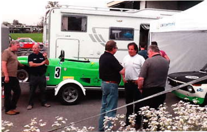
Benzingespräche im Fahrerlager