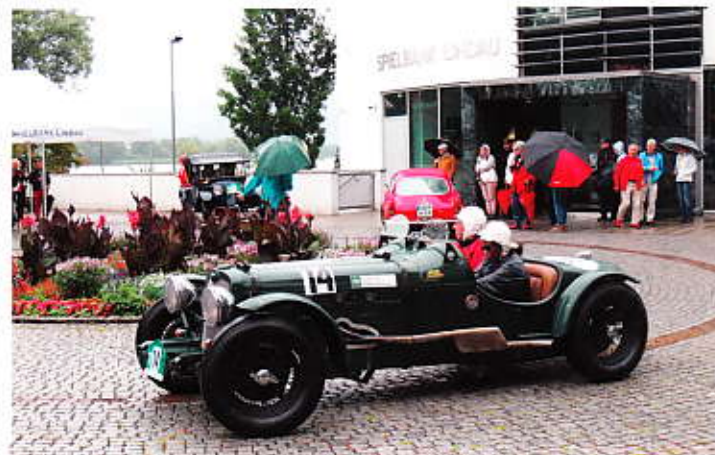
Im Ziel und nass bis auf die Knochen