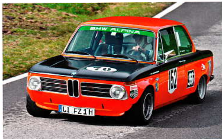
Karl-Heinz Schlachter mit dem BMW 2002 ti Alpina