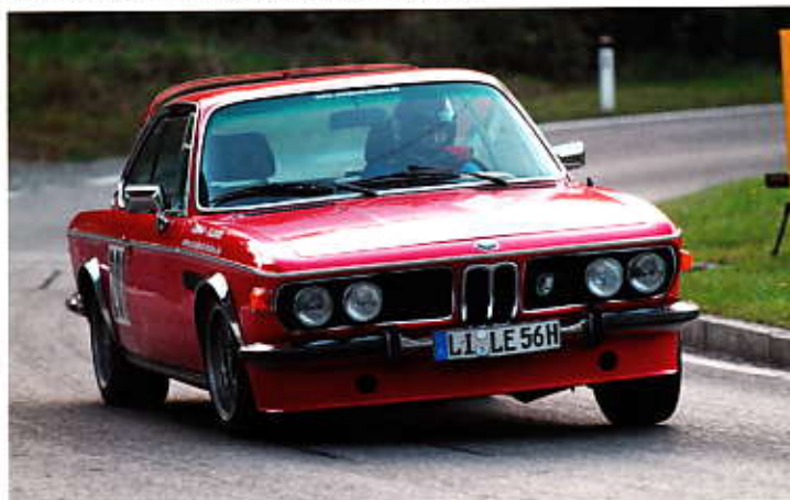
Ernst Laufer mit BMW 3,0 CSi Bj. 1975