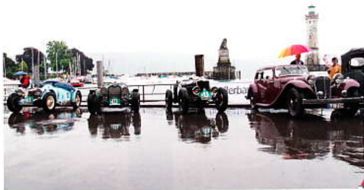
Sauwetter zum Start