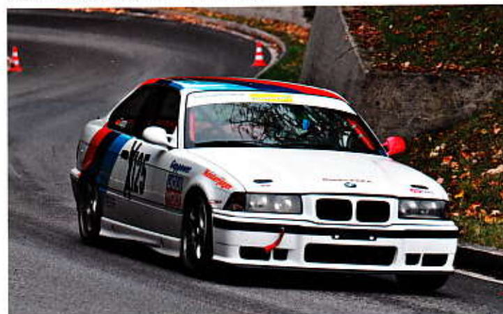
Norbert Gapp mit dem BMW M3 beim Bergslalom