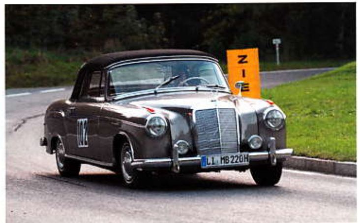
Manfred Biesinger mit MB 220 SE Cabrio Bj. 1957