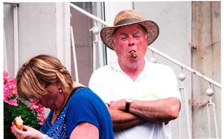
In der Ruhe liegt die Kraft