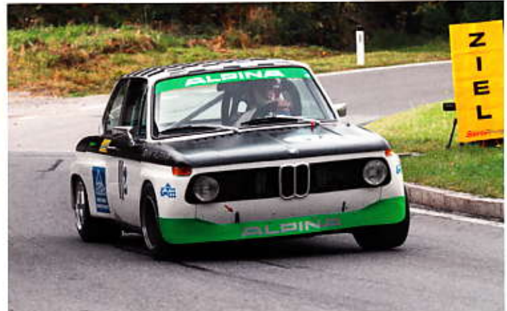
Karl-Heinz Schlachter mit BMW 2002 Gruppe H