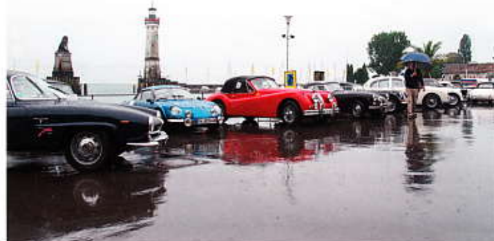
Bei der 19. Lindau-Klassik hat es nur einmal geregnet